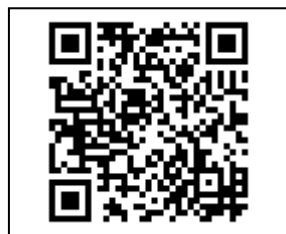
図 1-2 作成する二次元バーコードのイメージ

登記識別情報通知へ印字する二次元バーコードの画像データの設定値を表1-1に示す。なお、「コードの大きさ」、「モジュールの幅」及び「画素密度」は、登記識別情報(discriminfo.xml)に設定されている。